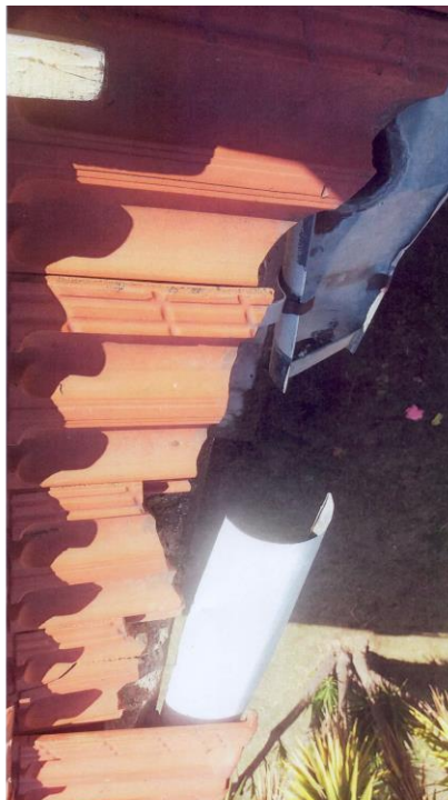
Εικ.5. Σπασμένα λούκια