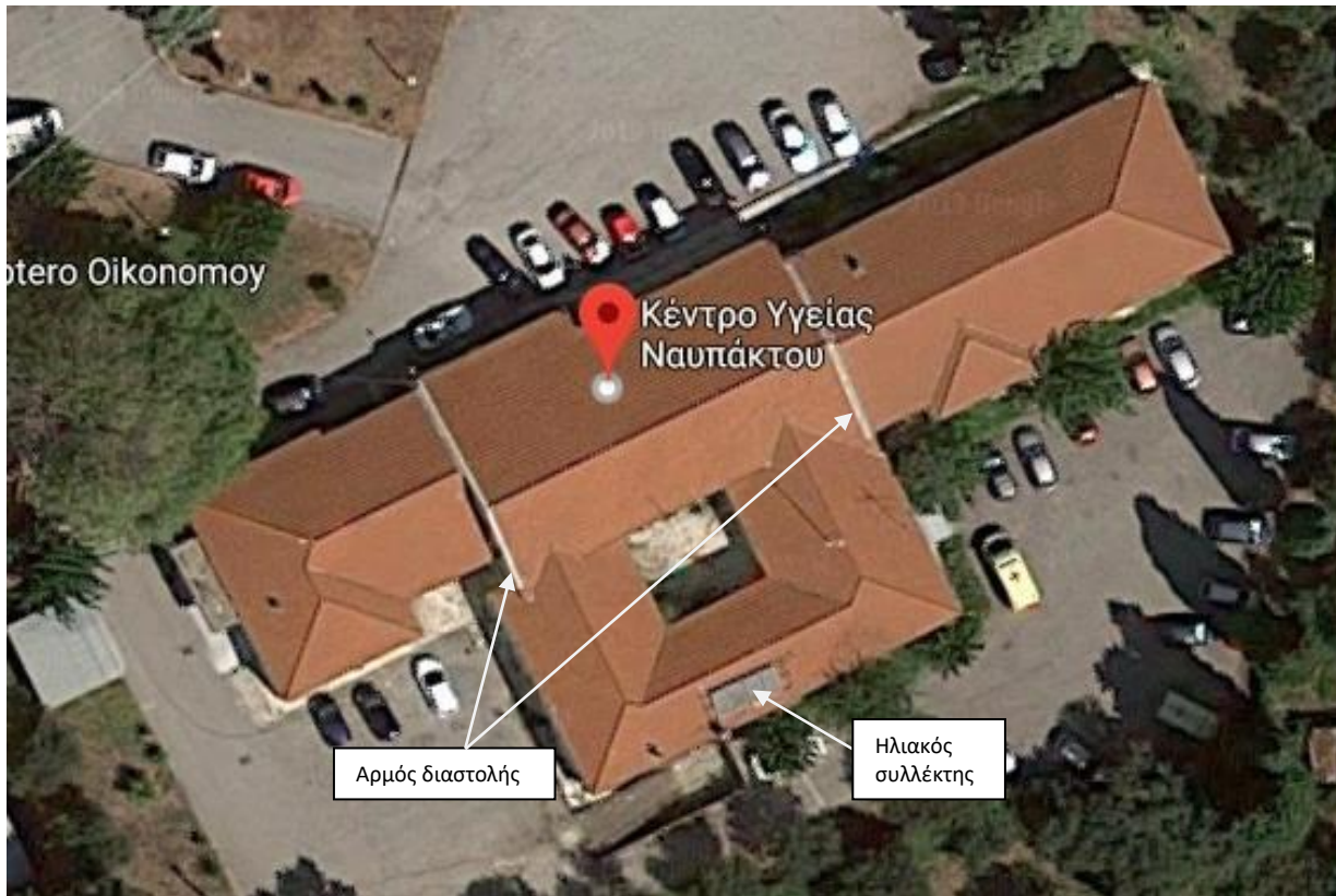
Εικ.1 ΚΥ Ναυπάκτου