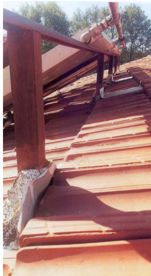
Εικ.3, 4. Φθορές στις ενώσεις των καμινάδων και των ηλιακών συλλεκτών