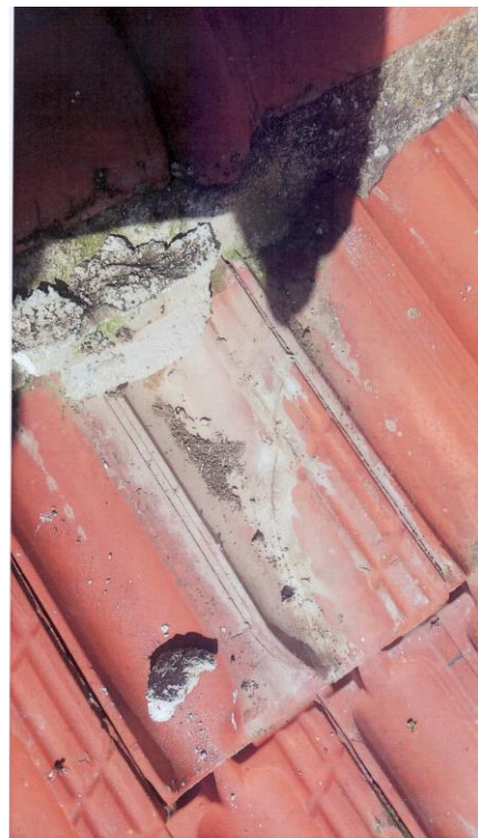
Εικ.2 Σπασμένα κεραμίδια