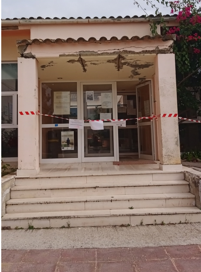
Φωτ. 1 Είσοδος ΚΥ Λευκίμμης