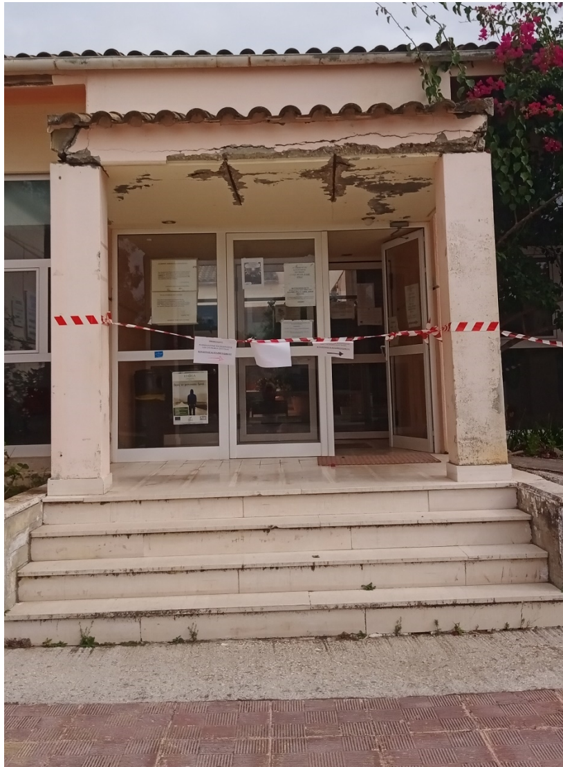
Φωτ. 1 Είσοδος ΚΥ Λευκίμμης